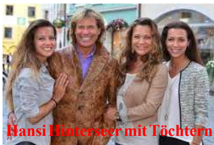
Hansi Hinterseer mit Töchtern