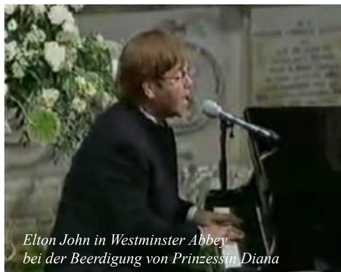
Elton John in Westminster Abbey bei der Beerdigung von Prinzessin Diana

Genau eine Woche danach, am 13. September 1997, kam diese Version in Großbritannien als Single mit dem Untertitel In loving memory of Diana, Princess of Wales und der B-Seite Something About The Way You Look Tonight in den Handel, verkaufte sich allein am ersten Tag 658.000 Mal, in der ersten Woche 1,5 Millionen Mal, 2 und 3 Millionen Mal innerhalb der ersten acht