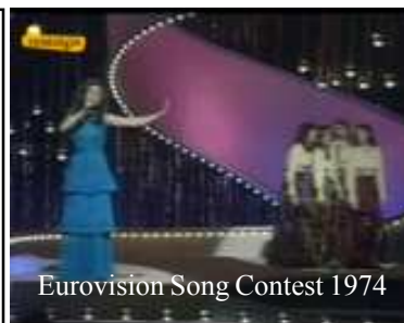
Eurovision Song Contest 1974