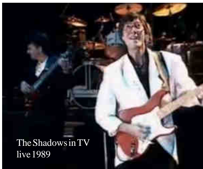
The Shadows in TV live 1989

Der "Mute-Guitar"-Sound entsteht dann, wenn der Gitarrist mit der Handfläche der Plectrum-Hand die Gitarren-Saiten am Gitarren-Steg leicht andrückt, so dass da ein "gedämpfter" Ton entsteht! Diese Sound ist mit der Zeit so typisch geworden, dass er den Einzug in die GM-Liste unter Nr.29 "Mute Guitar" erhielt. Dito auch mit dem "CLEAN-Guitar"-Sound unter der GM-Nr.28, welcher besonders in der tiefen Gitarren-Lage für einen einmaligen, klaren Gitarren-Solo-Sound sorgt! Die Rhythmus-Gitarre der Shadows (Fender-Telecaster) zeichnet sich aus durch möglichst permanente Anwendung aller 6 Gitarren-Saiten in der Begleitung, als "vollsaitige" Gitarre.